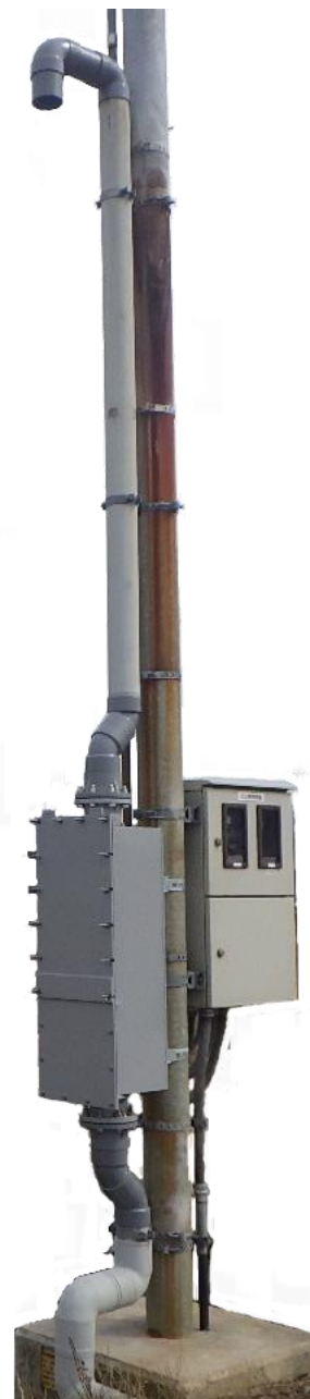
引込柱への設置例